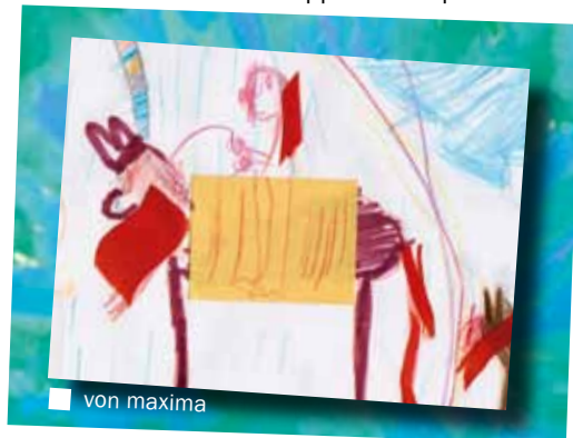
■ von maxima