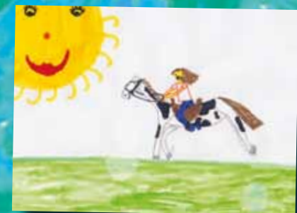
■ von bente