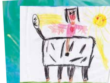
■ von elisa