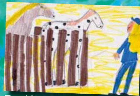
■ von jella